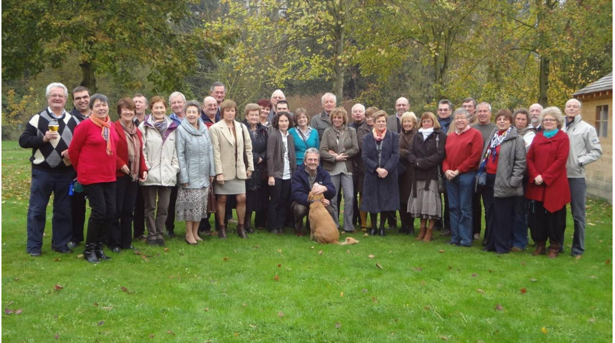
Photo : la plupart des pilotes par Eric, notre hôte au Croque le Temps à Hélécin. Certains étaient absents ou pas encore arrivés.

Chaque année, vos pilotes Amirando se retrouvent pour passer une journée ensemble au restaurant « Le Croque le Temps » à Hélécin. Après le petit déjeuner offert par Amirando, nous mettons au point le calendrier de toute l'année à venir avant de passer à table pour un délicieux repas. Au menu cette année le 18 novembre: la Louisiane.