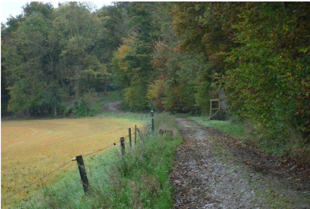
Les petits chemins comme Amirando les aime : Evelette octobre 2013.